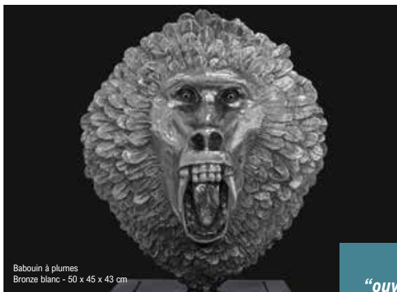
Babouin à plumes Bronze blanc - 50 x 45 x 43 cm

En 2018, lors de l'exposition organisée par la Ville de Château-Thierry et la Communauté d'agglomération, nous avons apprécié le monde de Mauro Corda, artiste aux multiples facettes. Cette exposition itinérante nous a surpris par ses sculptures tant contemporaines qu'insolites : un monde extraordinaire !