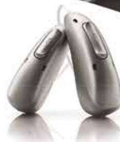
Phonak Audéo R Infinio