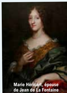
Marie Héricart, épouse de Jean de La Fontaine

l'image d'une femme de conviction, stratège et déterminée.