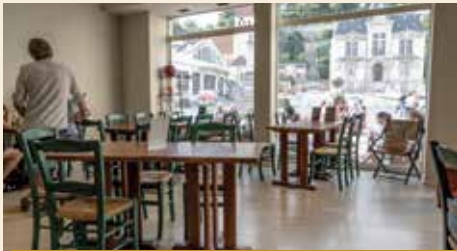
Pauline, gérante du bistrot de l'Hôtel de Ville et de l'Ouvrée

« Évidemment, les travaux c'est compliqué pour tout le monde, mais Rome ne se fait pas en un jour ! Pour le bistrot de l'hôtel de ville, c'est super car à terme, ça va être magnifique, il y aura des jeux de lumière et puis on vient de lancer l'activité, c'est nouveau. Je suis aussi propriétaire du restaurant l'Ouvrée et ça n'a pas empêché les clients de venir, on a juste eu quelques commentaires négatifs sur le parking éloigné et bien sûr, une baisse de chiffre d'affaires mais il faut être patient, je pense que ça reviendra à la normale quand ce sera terminé ».