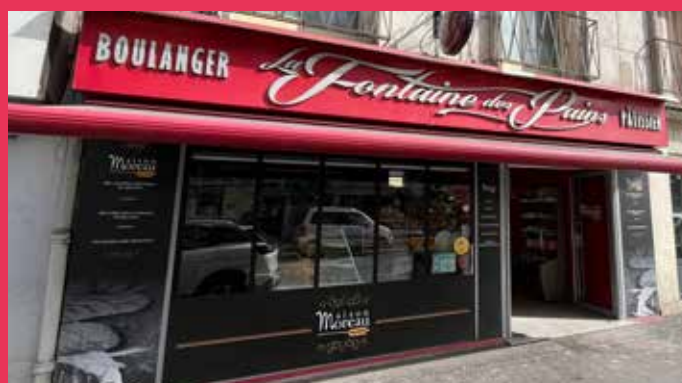
LA FONTAINE DES PAINS - 72, rue Carnot