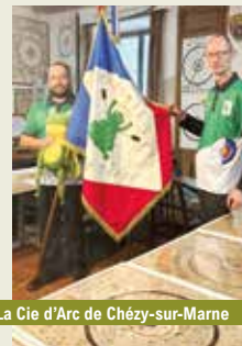
La Cie d'Arc de Chézy-sur-Marne