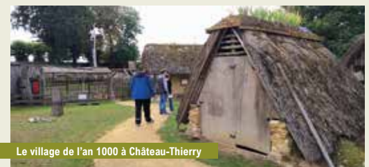
Le village de l'an 1000 à Château-Thierry