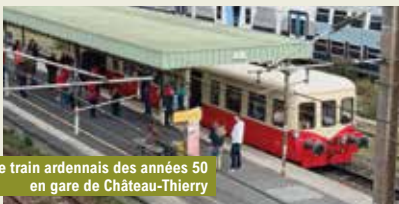
Le train ardennais des années 50 en gare de Château-Thierry

sur quelques unes de nos visites lors des Journées Européennes du Patrimoine