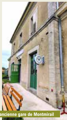
L'ancienne gare de Montmirail