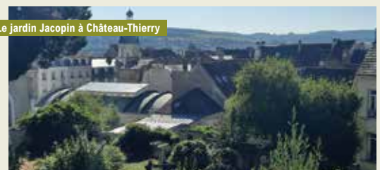
Le jardin Jacopin à Château-Thierry