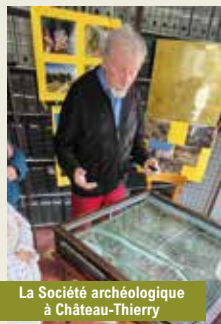
La Société archéologique à Château-Thierry