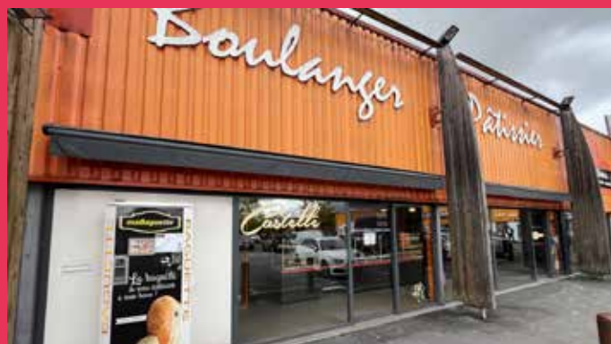
AUX BLANCHARDS Zone commerciale La Moiserie, route d'Étrépilly