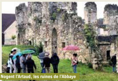
Nogent l'Artaud, les ruines de l'Abbaye