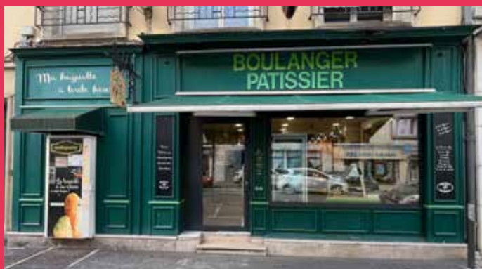
AU DÉLICE DU CARNOT - 47, rue Carnot