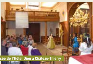
Musée de l'Hôtel Dieu à Château-Thierry