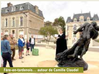
Fère-en-tardenois... autour de Camille Claudel