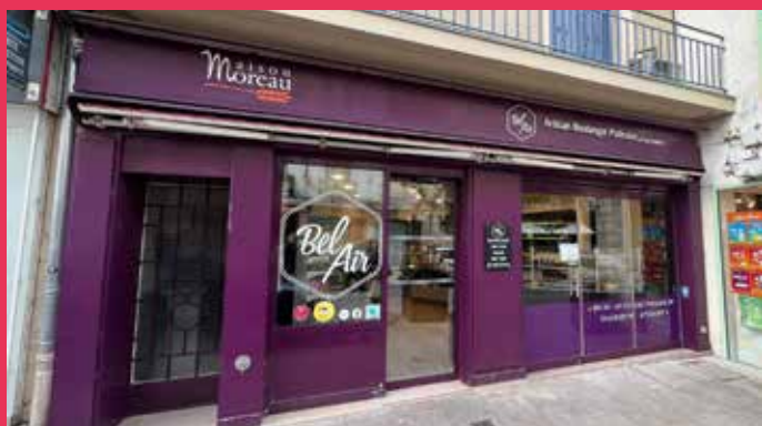
BOULANGERIE DE LA TOUR BALHAN 9, rue du Général de Gaulle